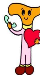
はなしてなごむ君