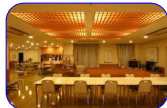
地域交流スペース