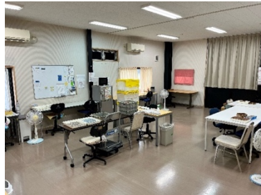
一人ひとりに合う作業環境を準備します